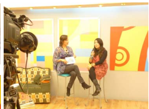
Programa “A Diario” (Digital 15 - TV Cable)